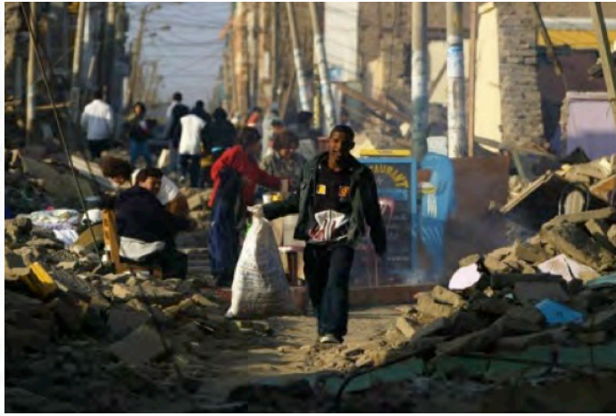
Terremoto de Pisco, 2007

A la fecha, los logros de este Equipo Comunitario de Respuesta a Desastre incluyen: