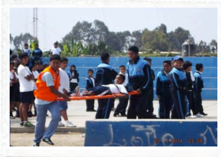
El equipo comunitario de respuesta a desastres apoyando en la evacuación de niños, jóvenes y adultos durante un simulacro