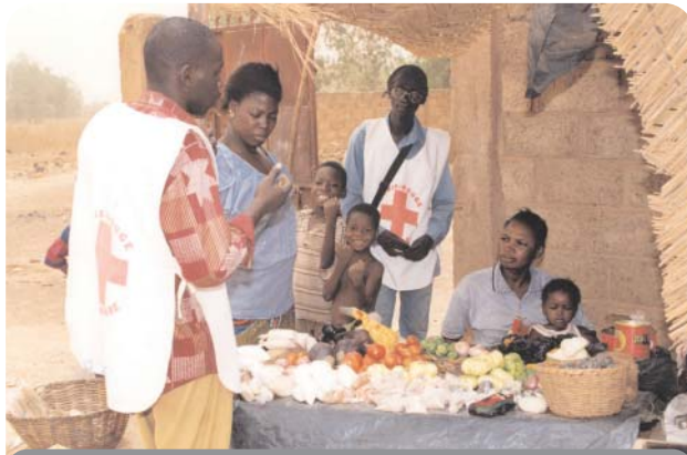
متطوع من الصليب الأحمر يجمع معلومات عن أسعار الغذاء في الأسواق المحلية.

وبعد الانتهاء من العمل الميداني، قام المشاركون بتحليل المعلومات التي تم جمعها ووضع البرامج وخطط العمل على المستويين القطري والإقليمي.