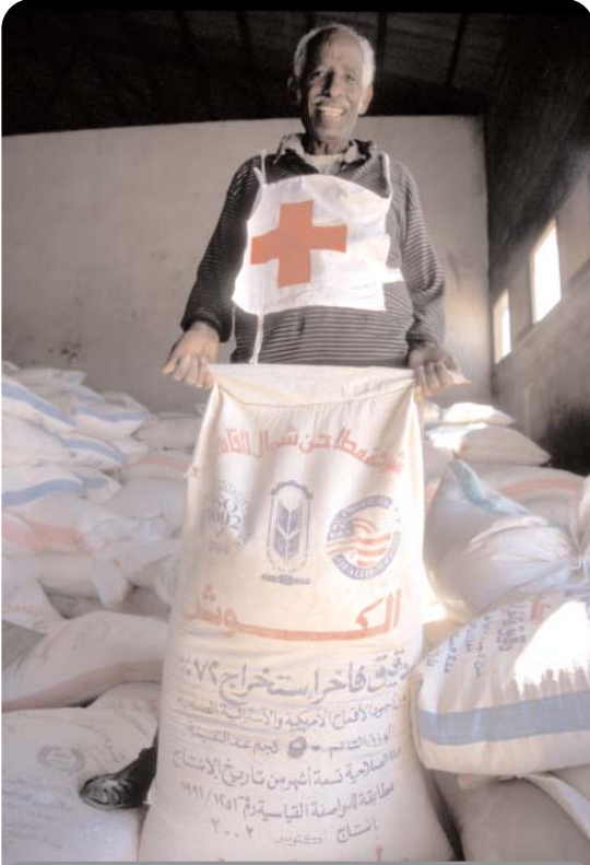
توزيع الأغذية في حالات الكوارث يعتبر أمراً عادياً في عمليات الصليب الأحمر والهلال الأحمر.

فريق العمل الإقليمي المعني بالأمن الغذائي هو مورد هام بالنسبة لإقليم شرق إفريقيا. وسوف يكون من المهم أن نضمن أن أعضاء الفريق يتم توزيعهم حتى يطبقوا عملياً ما اكتسبوه من مهارات جديدة. ويعتمد ذلك على شبكة الصليب الأحمر والهلال الأحمر في الإقليم مما يساعد على توزيع أعضاء الفريق في مواقع العمل. ومن المهم مواصلة عقد دورات للتذكير وتوفير التدريب للاحتفاظ بعدد محدد من أعضاء الفريق بمضي الزمن ليظل فريق العمل المعني بالأمن الغذائي ممارساً لوظيفته بشكل متواصل.