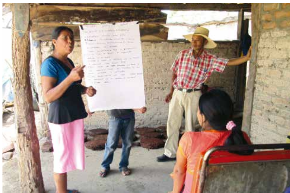
Presentación de resultados del trabajo.

“Los conocimientos que adquirí en la escuela nadie me lo va a quitar. Para mí es mejor que un machete, porque esto se va a gastar y mis conocimientos no”