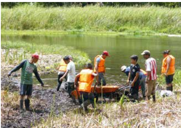
Limpieza de la laguna La Bruja en la comunidad El Pegador en la escuela de campo Ecoturismo Comunitario.

Estos microproyectos fueron diseñados de manera participativa mediante talleres con los comunitarios; así que los comunitarios igualmente decidieron sobre las temáticas de las escuelas de campo. Por este proceso participativo, se asegura el apropiamiento de los microproyectos por los comunitarios. Igualmente asegura el aprendizaje y su aplicación de las escuelas de campo.