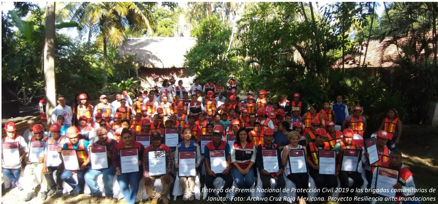
Entrega del Premio Nacional de Protección Civil 2019 a las brigadas comunitarias de Januta. Foto: Archivo Cruz Roja Mexicana. Proyecto Resiliencia ante Inundaciones

La Alianza Zurich para la Resiliencia ante Inundaciones es una asociación multisectorial que desarrolla en conjunto programas comunitarios, nuevas investigaciones, conocimientos compartidos y realiza incidencia basada en evidencias para aumentar la resiliencia de las comunidades susceptibles a inundaciones, localizadas en países desarrollados y en vías de desarrollo.