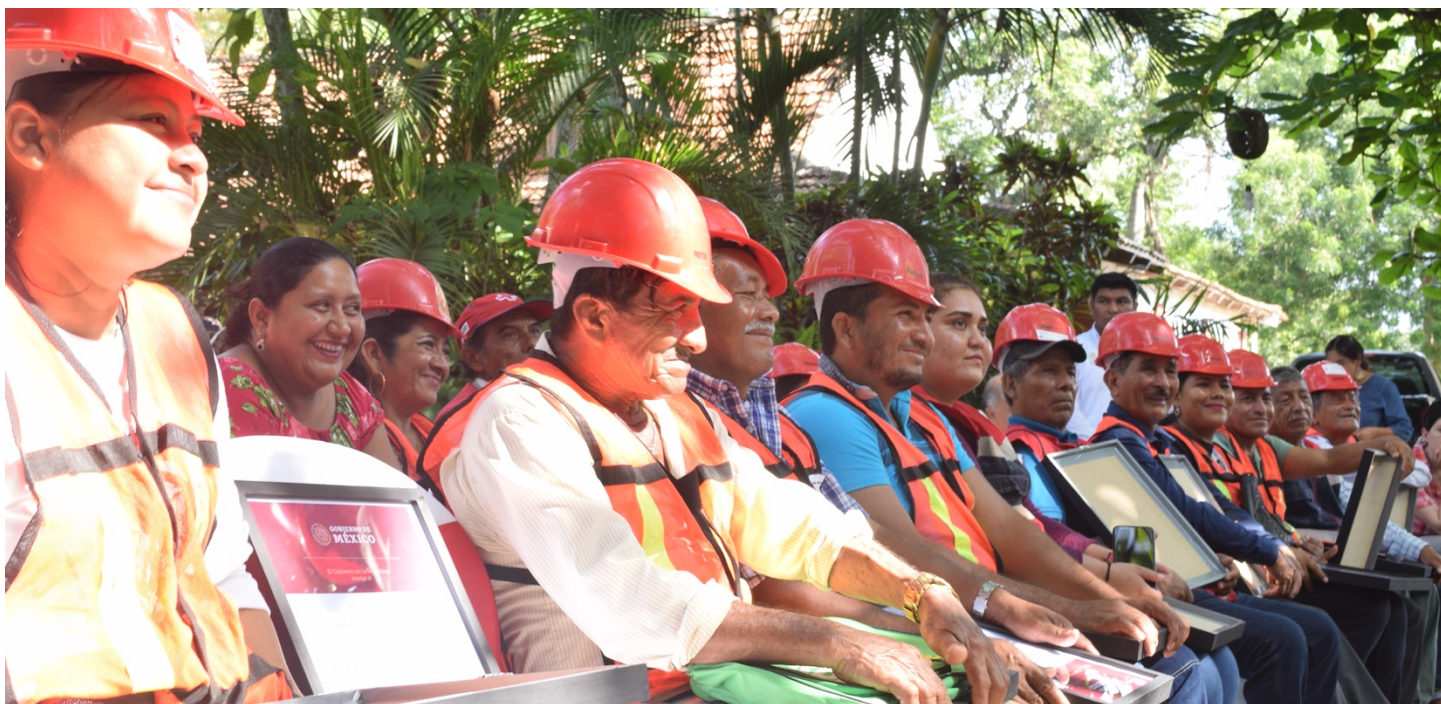
Entrega del Premio Nacional de Protección Civil 2019 a las brigadas comunitarias de Jonuta. Foto: Archivo Cruz Roja Mexicana. Proyecto Resiliencia ante Inundaciones.

En la actualidad, hay 22 brigadas comunitarias con 204 miembros activos que se movilizan con éxito para preparar a las comunidades y reducir el impacto de las inundaciones. Esto representa 10 años de esfuerzo y coordinación, y cada paso se basa en el anterior.