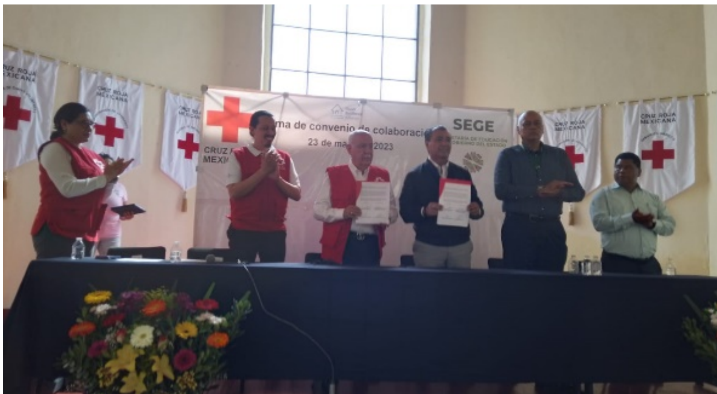
Firma de convenio de colaboración con la Secretaría de Educación del Gobierno del Estado de San Luis Potosí. Proyecto Resiliencia ante Inundaciones.