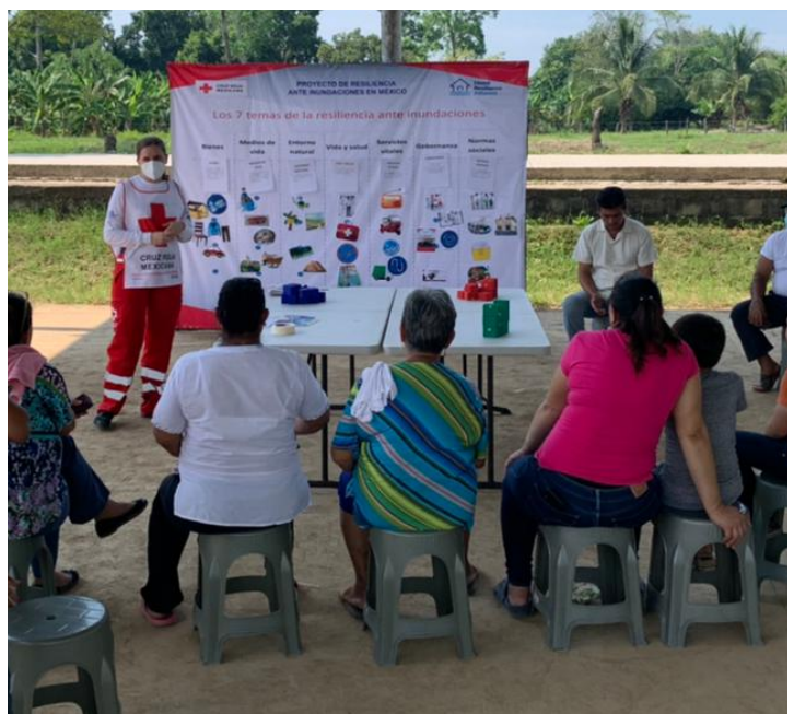
Entrega de resultados de la medición de la resiliencia a líderes comunitarios Foto: Archivo Cruz Roja Mexicana. Proyecto Resiliencia ante Inundaciones

Durante esta fase, el equipo del proyecto se centró en establecer relaciones con el gobierno local y las comunidades, involucrándolas en el proceso de medición de la resiliencia comunitaria y estableciendo un modelo de gobernanza sólido para el proyecto a largo plazo.