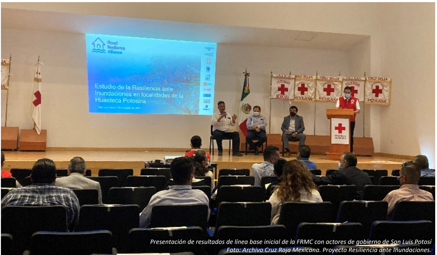
Presentación de resultados de línea base inicial de la FRMC con actores de gobierno de San Luis Potosí Proyecto Resiliencia ante Inundaciones.