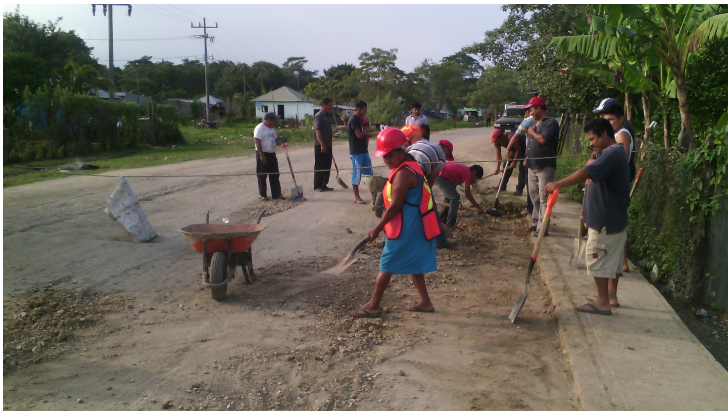
Brigada comunitaria limpiando calles principales y zonas del borde que protegen a la comunidad. Proyecto Resiliencia ante Inundaciones.

A continuación, se destacan los elementos críticos de cada etapa y se muestran cómo se aprovechan los componentes básicos (Figura 1) para la evolución de la implementación hacia la siguiente etapa.