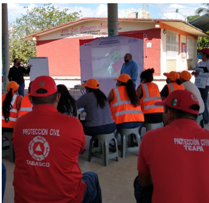
La Comisión Nacional del Agua impartió una capacitación a la brigada comunitaria y a Protección Civil de Teapa. Proyecto Resiliencia ante Inundaciones.